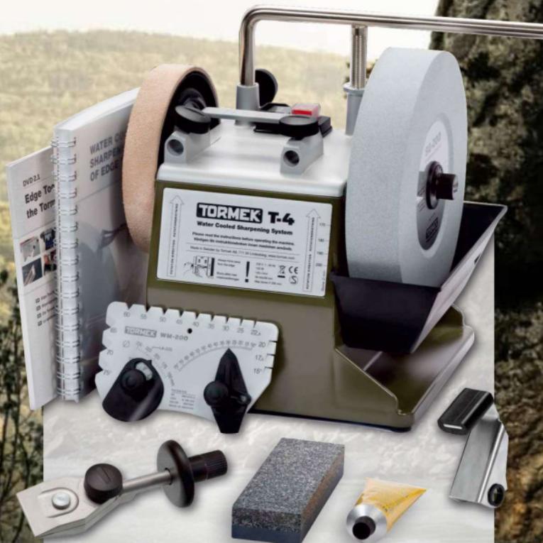
Die Sonderedition Bushcraft enthält die Schleifvorrichtung für Messer SVM-45 und die Vorrichtung SVA-170 für Äxte, zusammen mit dem gesamten Standardzubehör; Steinpräparier SP-650, Winkellehre WM-200, Abziehpaste PA-70 und Tormek-Handbuch.

Die Tormek T-4 Bushcraft verfügt über ein massives Zink-Gehäuseoberteil zum Schutz der innenliegenden wichtigen Maschinenkomponenten wie Motor und Hauptwelle. In die Oberseite sind Hülsen für die Universalstütze eingegossen. Der untere Gehäuseteil besteht aus geformtem ABS-Kunststoff. Dadurch ist die Maschine schlagfest und stabil und arbeitet mit unerreichter Präzision. Am integrierten Griff kann die Maschine bei Bedarf leicht bewegt werden.